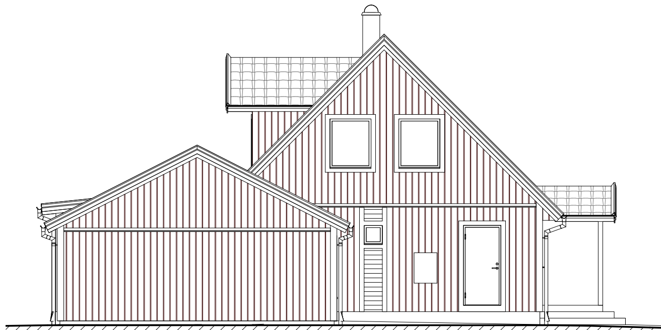
Fasad mot Sydost