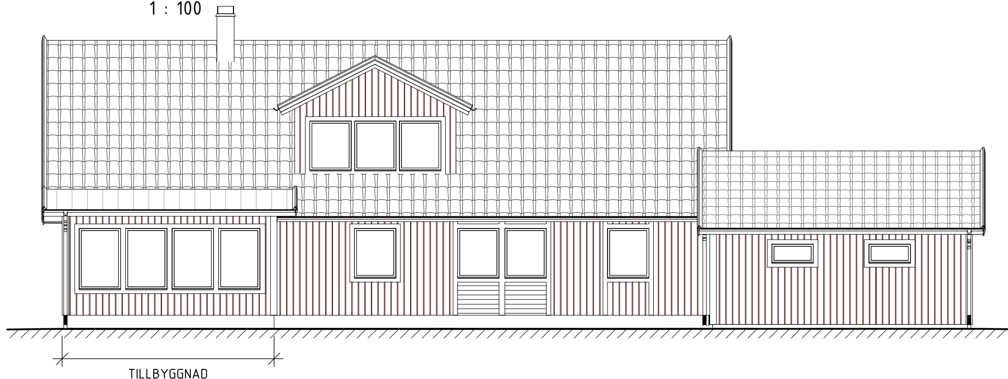
Fasad mot Sydväst