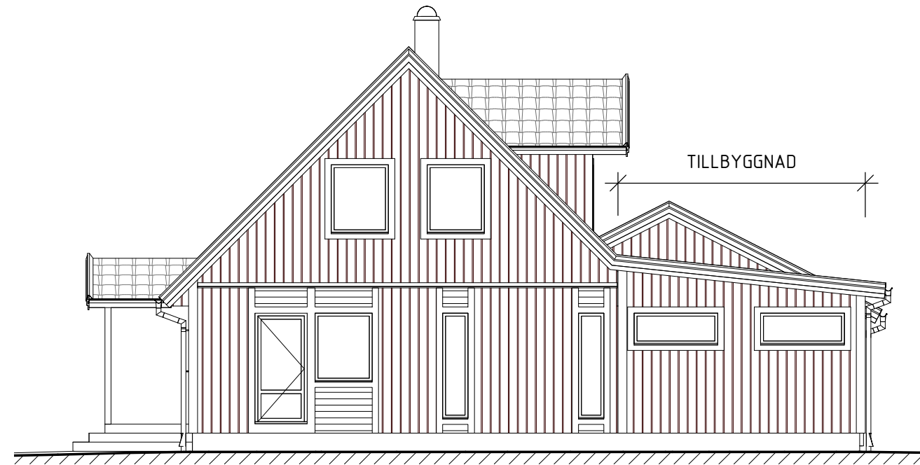
Fasad mot Nordväst