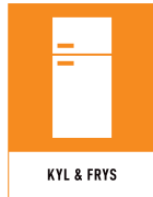
KYL & FRYS