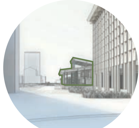
VY FRÅN ÖSTRA DELEN AV SÖDRA JÄRNVÄGSGATAN