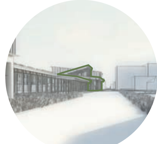
VY FRÅN VÄSTRA DELEN AV SÖDRA JÄRNVÄGSGATAN