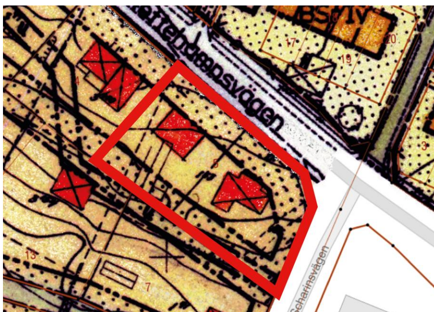
Figur 2: Urklipp från gällande detaljplan. Planområdet är inringat med rött.

För området gäller detaljplanen "Del av stadsdelen INNERURSVIK och FURUNÄS" antagen 1958-03-21. Där anges marken för bostads ändamål. Bostäderna skall vara friliggande villor i högst två våningar. Fastigheten används idag som centrumverksamhet och har gjort det sedan flera år tillbaka.