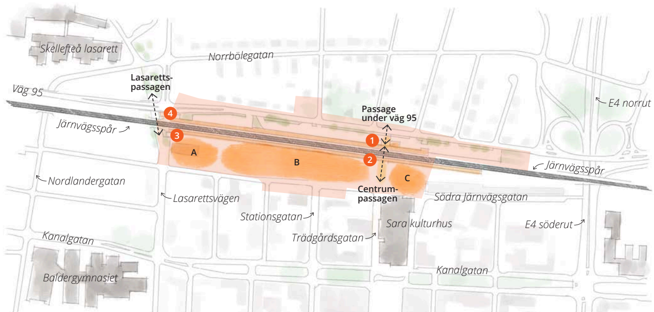
1-4 Lyftpaket till plattform A Västra kvarteret B Resecentrumbyggnad och bussterminal C Parkeringshus