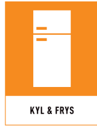
KYL & FRYS