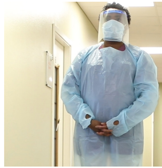
Ta på visir