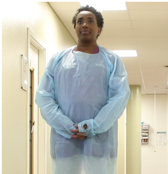
Ta på långärmat skyddsförkläde