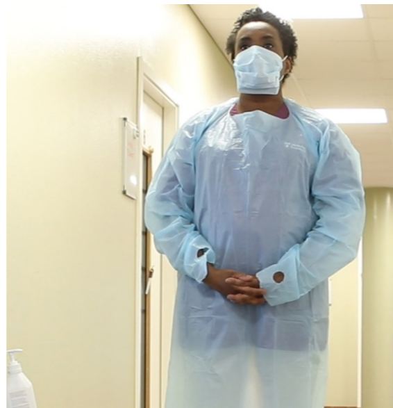
Ta på andningsskydd/munskydd