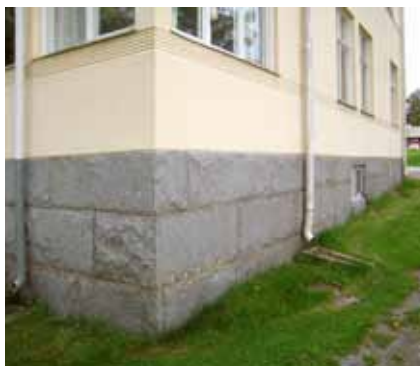
Sockel av huggen sten, 1920-tal.