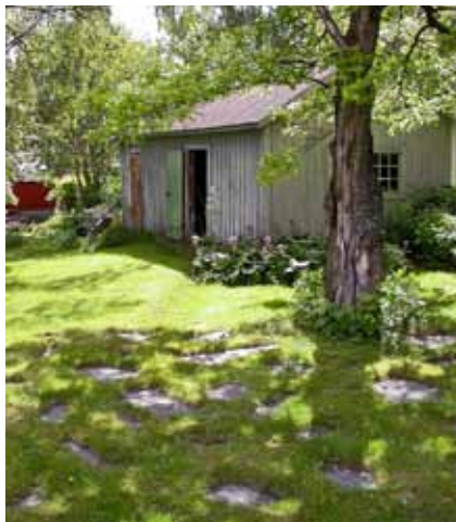
Skiffergång och uthus, 1930-tal.

En gjuten sockel är bäst obehandlad eller gråmålad. Höga vita eller svarta socklar förtar verkan av ett vackert timmerhus eller träpanelat hus. En sockel av natursten är allra vackrast till en traditionell byggnad.