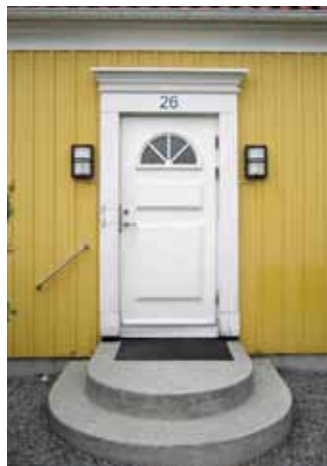
Spegeldörr med lunettfönster, 1990-tal.