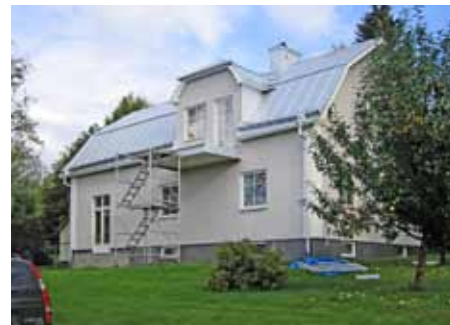
Utbyggnad på längden.

Arkitekt hjälp kan vara klokt när du planerar att bygga om eller till ditt hus. Det bidrar till att ge ditt hus genomtänkta former och funktioner och ett vackert utseende och är därför en investering.