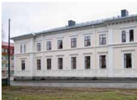
Ljusa fasader med kulörta fönsterbågar var typiskt för sekelskiftet 1900.