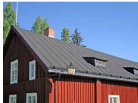
Papptak, 1800-talets slut.

Takkupor förekommer ibland på äldre hus. Nya takkupor kan ibland accepteras, men ska då vara anpassade till husets karaktär och samordnas med fasaden. Byggnaden får inte se överlastad ut.