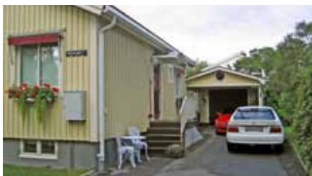
Tillbyggd carport, indragen på gården.