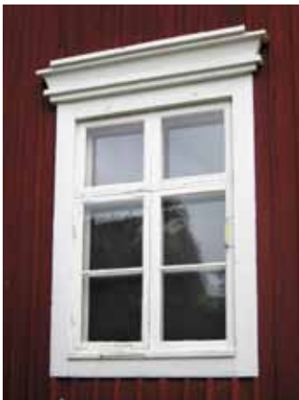
Korspostfönster med profilerat överstycke, 1800-tal.

Bågarnas insidor och karmarnas poster var under 1800-talet rikt profilerade, och fönsterglas var fram till 1920-talet munblåst – det var alltså lite ojämnt med små blåsor i glasmassan. På äldre hus bör därför t.ex. vippfönster, aluminiumbågar och fuskpröjsar undvikas.