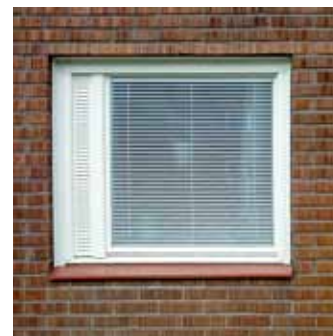
Fönster med vädringslucka, 1960-tal.