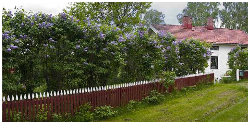
Traditionellt trästaket, 1800-1900.