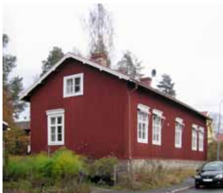
Faluröda hus blev allmänna under 1800-talet. Detaljerna målades gråvita.

Bebyggelsens färgsättning har växlat med modet. Färgsättningen men även färgtypen (linolja, lasyr, slamfärg) säger mycket om ditt hus. Rådgör gärna med experter innan ommålning. Ofta kommer huset bäst till sin rätt om det målas i sina ursprungliga eller i för tiden typiska kulörer.