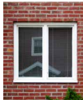
Tvåluftsfönster med fast mitt-post, 1940-tal.