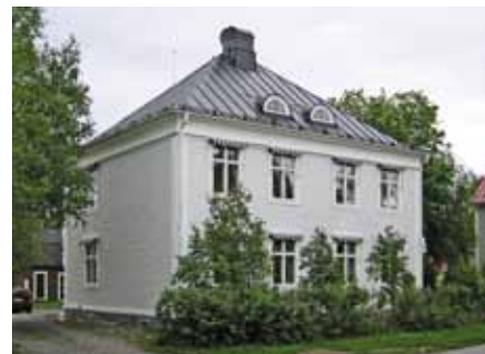
Under 20-talsklassicismen var ljusa stenimiterande färger vanligt.