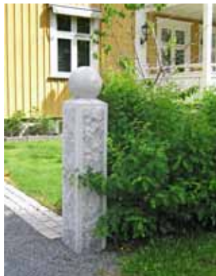
Grindstolpe av huggen sten, 1900-tal.

Befintliga grindstolpar är viktiga tidsmarkörer som bör bevaras och vårdas. Balkong- och altanräcken samt staket i järn är viktiga bärare av husets karaktär. De bör så långt det går vårdas och bevaras, och inte ersättas av klumpigare träkonstruktioner.