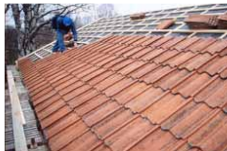
Tvåkupigt lertegeltak, 1930-tal.