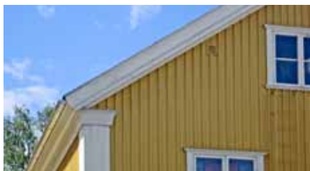
Omvikt takfot, 1920-tal.