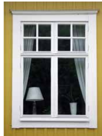
Korspostfönster med små spröjs upptill, 1910-tal.