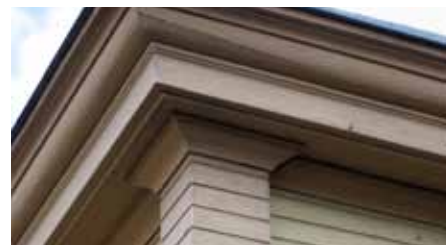
Inklädd takfot, 1800-tal.