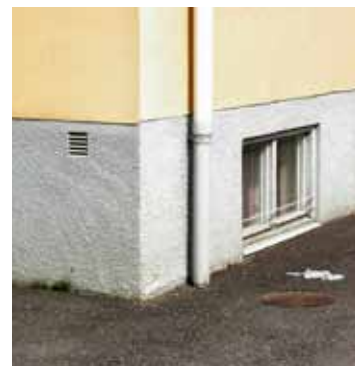
Gjuten sockel, 1940-tal.