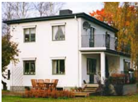
Idealet under funktionalismen på 1930-talet var ljusa putsade fasader.