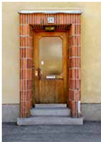
Dörr av ädelträ med tegelomfattning, 1950-tal.