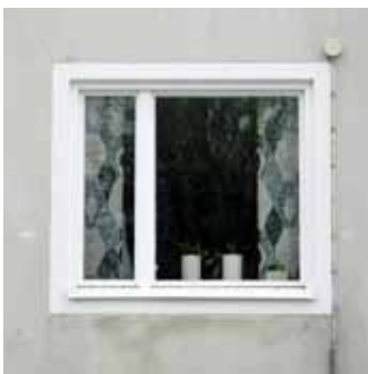
Tvåluftsfönster med förskjuten mittpost, 1950-tal.