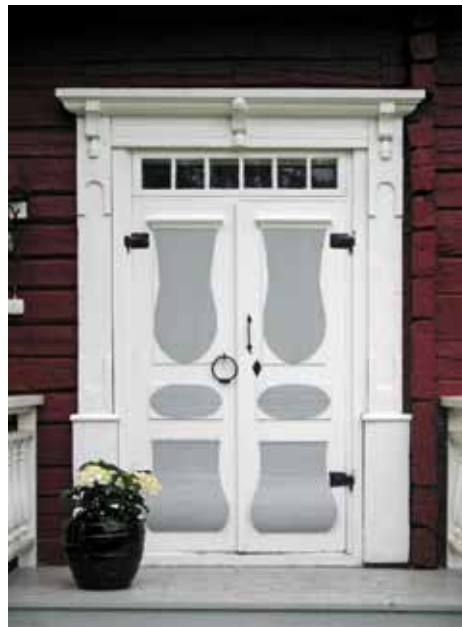
Pardörr med överljus och rikt detaljerad omfattning, 1800-tal.

Många hus har ofta bearbetade omfattningar runt entrén som berättar om tidens mode, materialkänsla och hantverkskunnande. Dessa bör därför bevaras så långt möjligt.