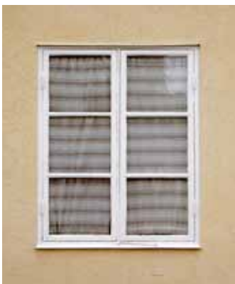
Sexdelat fönster utan foder, 1920-tal.