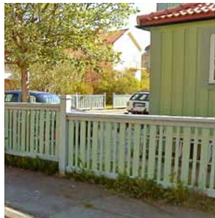
Modernt trästaket, 2000-tal.