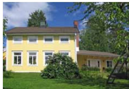
Utbyggnad i vinkel.