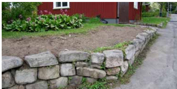
Terrassering mot gata, 1960-tal.