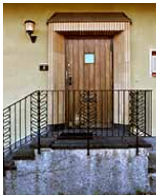
Smitt broräcke, 1950-tal.