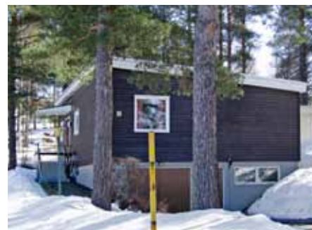
Brunlaserade fasader var populärt på 1950- och 60-talen.