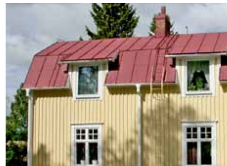
Falsad plåttak, 1900-tal.