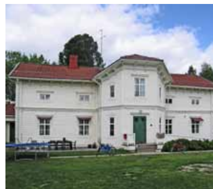
Vid mitten av 1800-talet blev vita hus populärt.