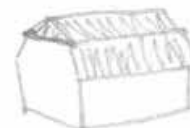
Halvalmat brutet tak