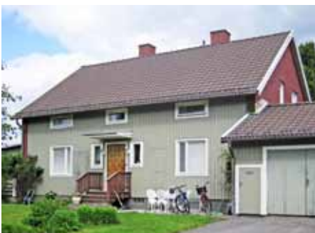
Under 1940- och 50-talen började man måla husen i mättade färger.