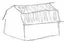
Brutet tak (Mansardtak)