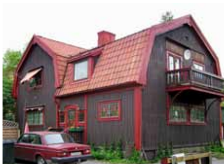
Under nationalromantiken var bruna fasader och röda eller gröna detaljer modernt.