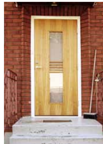
Modern dörr av ädelträ, 2000-tal.