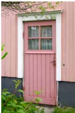
Enkeldörr med glasad överdel, 1920-tal.